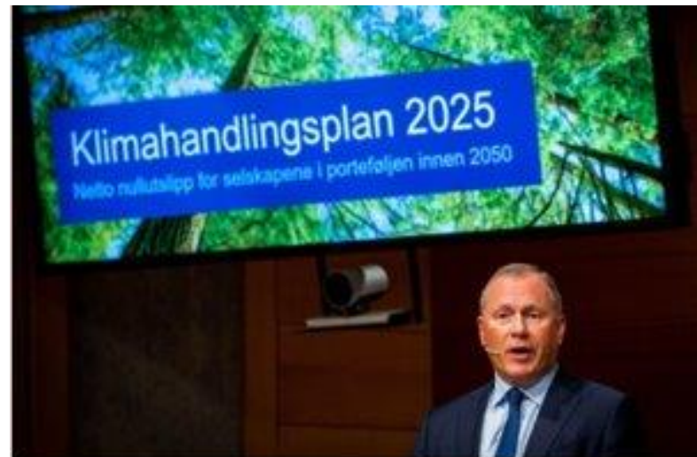
Øyjafondsjøf Nicolai Tangen legger frem en klimaplan.

«Hvis ikke du ikke tar dette på alvor, er det ingen som vil jobbe hos deg, ingen som vil kjøpe produktene dine, ingen banker som vil låne deg penger og ingen forsikringselskap som vil forsikre deg»