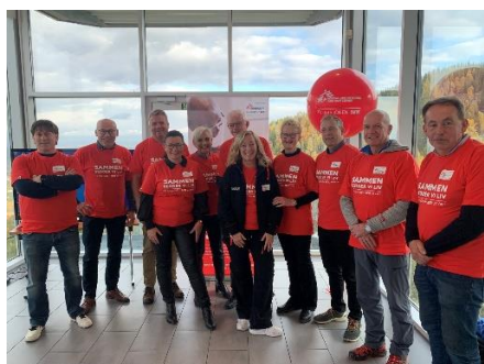
Fra TV- aksjonen 10.oktober 2022