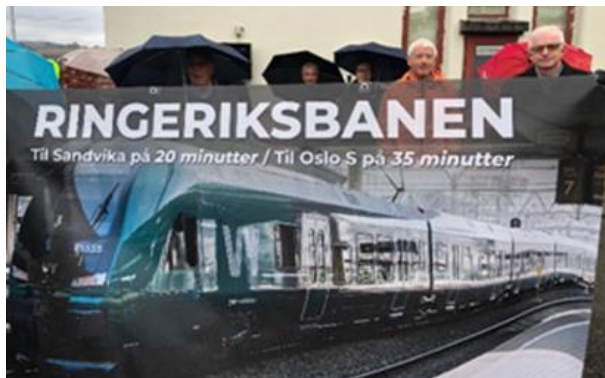
Fra møte med samferdselsministeren 26. april 2022 Fra togturen Oslo-Bergen 7. november 2022