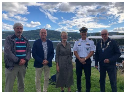
Fra lanseringen av felles veteranplan for Ringeriksregionen, 18. august 2023

Det ble arrangert en miniworkshop på IPR- møtet 22. mai, det siste møtet før Kommune- og fylkestingsvalget i september med tittelen « Hvordan viderefører vi samarbeidet ».