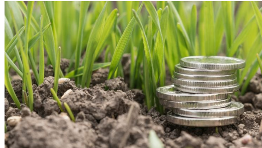
Økonomisk verdi av matjordas økosystemtjenester (PhD)