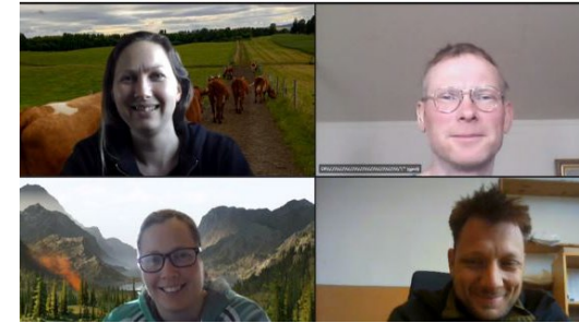
Landbruksprosjekt i Midt- Buskerud