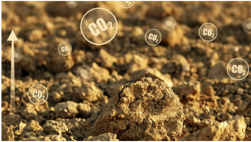
Jordhelse og karbonfangst