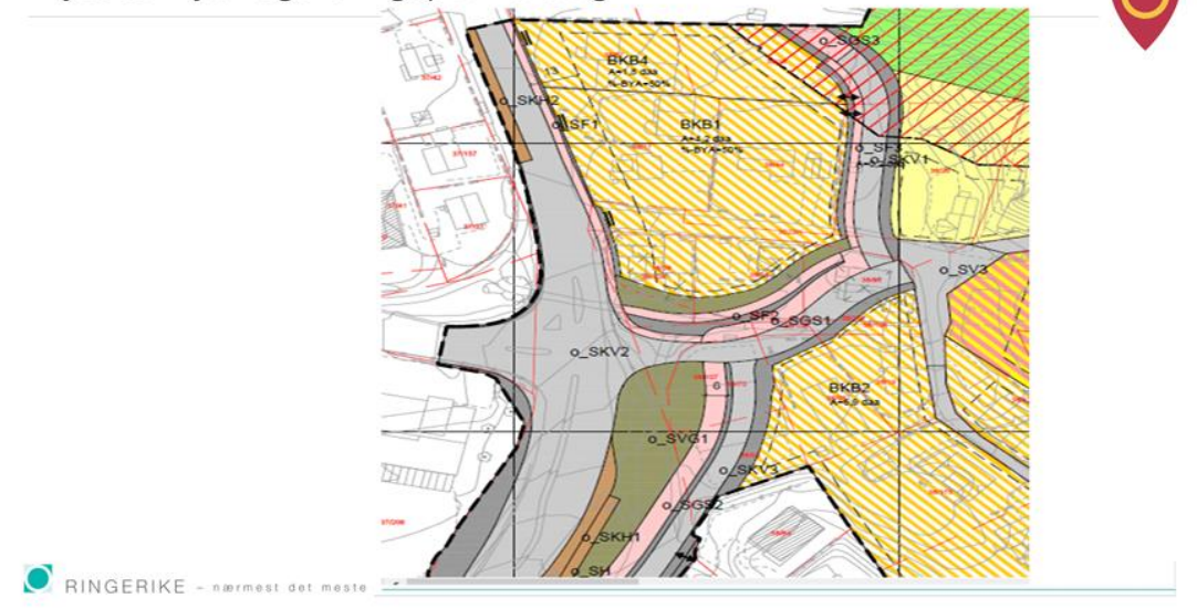
Krysset i nytt reguleringsplanforslag

Fra Ringerikes kommunes orientering i kommunestyret 3.6.2021