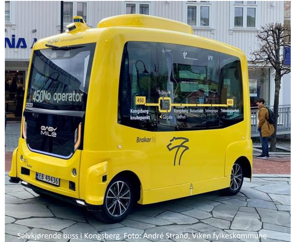
Selvkjørende buss i Kongsberg.