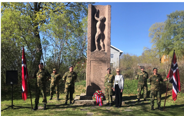
Bilde: 8. mai markering, Heggeni Modum.

I dag er det nesten ingen som er med på 8. mai-markeringene som selv deltok under andre verdenskrig. Dagens markeringer må derfor treffe alle fra de som tjenestegjorde i Tysklandsbrigaden, eller under Koreakrigen rett etter 2. verdenskrig, til våre veteraner som er kommet hjem fra blant annet Bosnia, Irak, Libanon, Afghanistan, Tsjad og Sør-Sudan.