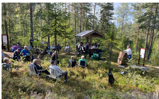
Bilde: Fra Grencelledagen, Eiker, Modum og Sigdal forsvarsforening.

Veteran- markeringene må utvikles i spenningen mellom tradisjoner og fornyelse.