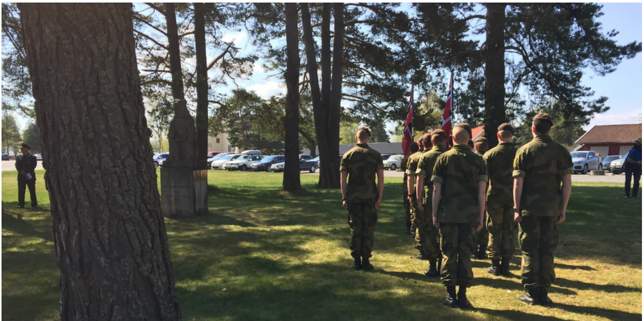
Bilde: 8. mai markering på Helgelandsmoen i Hole kommune.

Helgelandsmoen og Hvalsmoen var mobiliseringsplasser for de norske styrkene da andre verdenskrig brøt ut i 1940.