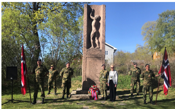
Bilde: 8. mai markering, Heggeni Modum.

I dag er det nesten ingen som er med på 8. mai-markeringene som selv deltok under andre verdenskrig. Dagens markeringer må derfor treffe alle fra de som tjenestegjorde i Tysklandsbrigaden, eller under Koreakrigen rett etter 2. verdenskrig, til våre veteraner som er kommet hjem fra blant annet Bosnia, Irak, Libanon, Afghanistan, Tsjad og Sør-Sudan.